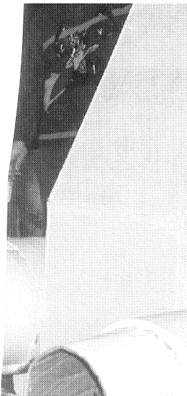
quel elle défilera pour

CHEZ, tél. 03.29.28.10.34 0.35, e-mail : raymond. res en façade de l'espace